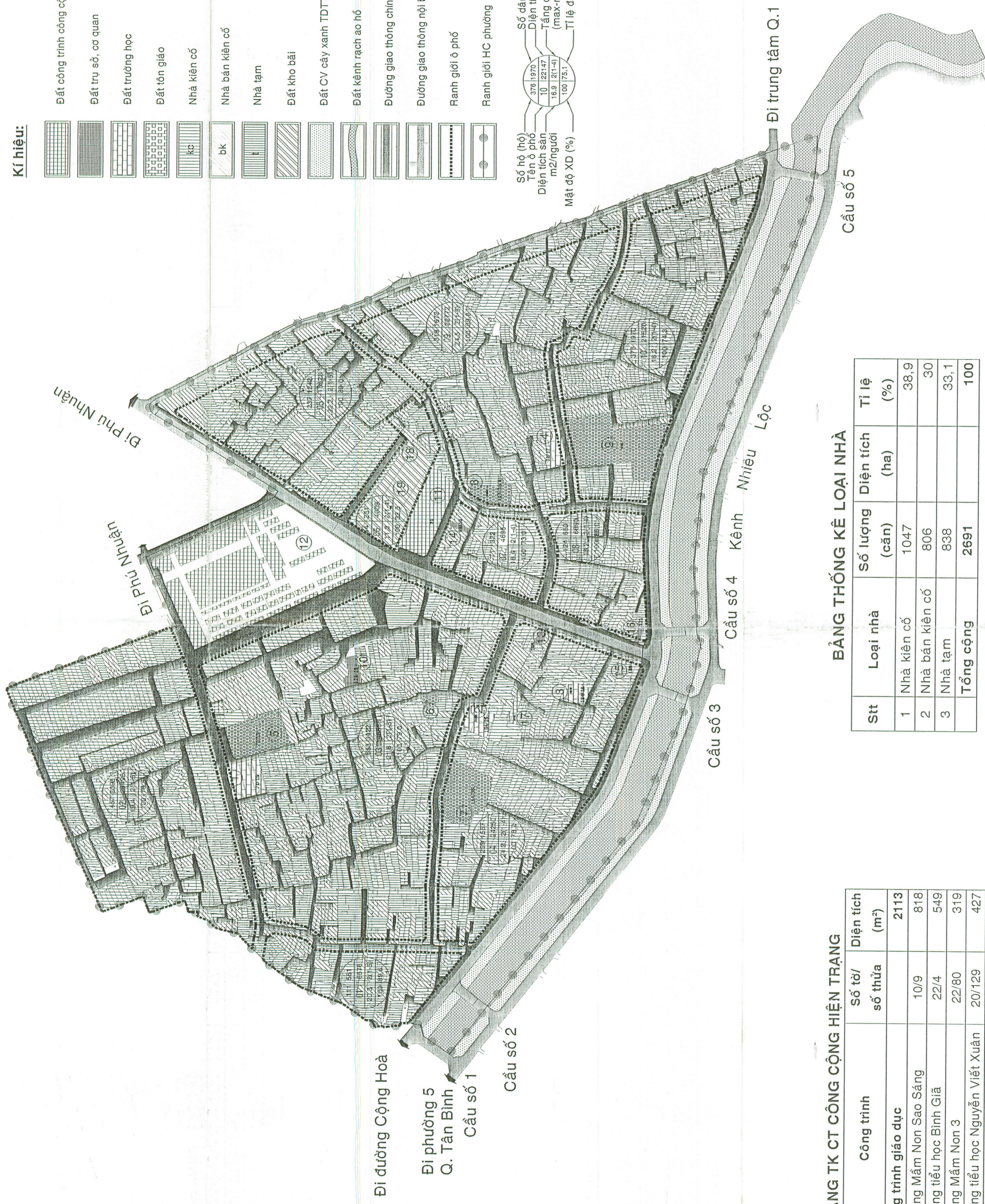
BẢNG TK CT CÔNG CỘNG HIỆN TRẠNG